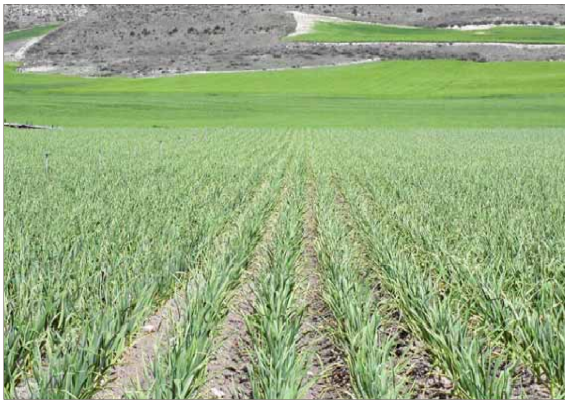
Plantación de 'Ajos de Vallelado'.